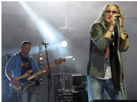
Na występ Grzegorza Markowskiego z grupą PERFECT fani czekali od roku

Na występ grupy PERFECT fani czekali już od ubiegłego roku (koncert został wówczas odwołany ze względu na chorobę wokalisty). Mielśmy okazję usłyszeć niezapomniane hity oraz utwory z nowej płyty. Nie płacz Ewka, Kołysanka dla nieznajomej,