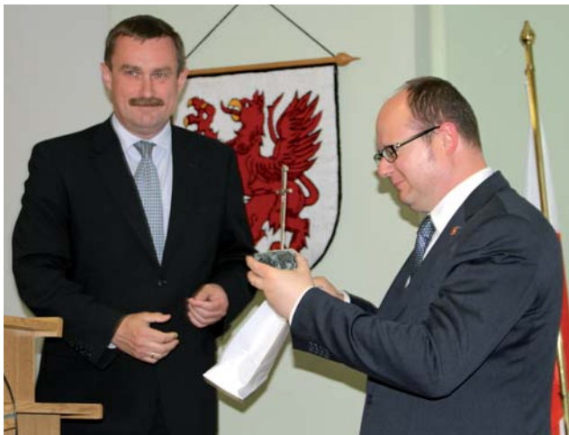
Prezydenci Tczewa i Gdańska podczas spotkania w Urzędzie Miejskim