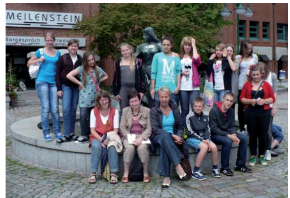
Grupa uczestników przed ratuszem w Norderstedt

Oprócz programu dla uczniów był również specjalny program dla opiekujących się nimi nauczycieli, gdzie m.in. uczestniczyli w pokazie filmowym pt. „Długa noc krótkich filmów”. Były to fragmenty muzyki filmowej z bardzo znanych produkcji wykonywane raz przez orkiestrę kameralną, a innym razem przez chór. Występom tym towarzyszyły pokazy krótkich filmów nagrodzonych Oskarami, wśród których znalazło się też dzieło polskiego reżysera, „Tango” Zbigniewa Rybczyńskiego.