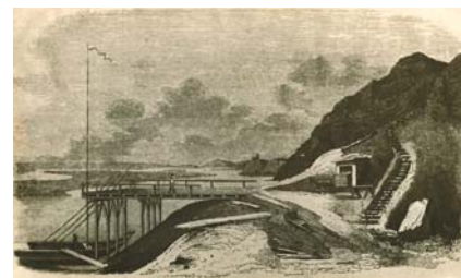
Cegielnia w Knybawie – rycina

I już na zakończenie parę słów o nietypowym przedmiocie jak na zbiory bi-