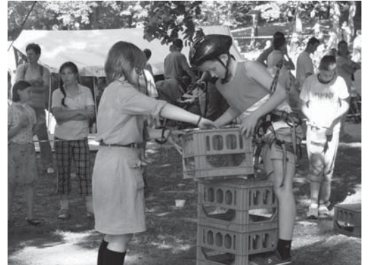
Harcerski Dzień Dziecka to jedna z propozycji realizowanych w ramach projektu „Aktywni z harcerzami...”

• W ramach projektu „Dialog o Tolerancji – obóz dla młodzieży z miast partnerskich Tczewa” współfinansowanego z Programu „Europa dla Obywateli”, w dniach 21 – 30 lipca 2008 r., na terenie bazy harcerskiej niedaleko Osieka, odbył się obóz młodzieżowy, którego uczestnikami byli przedstawiciele trzech państw: Litwy, Łotwy i Polski,