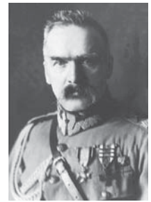
Marszałek Józef Piłsudski

polskich, tak wielkie, że nie dało się go wytłumaczyć w sposób czysto naturalny i dlatego zostało nazwane Cudem nad Wisłą. To zwycięstwo było poprzedzone żarliwą