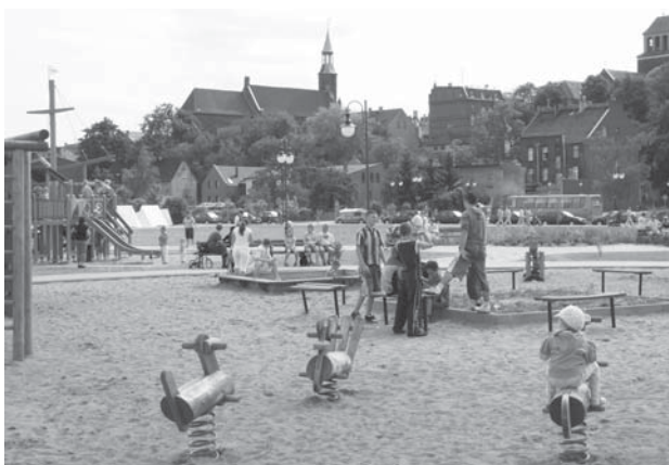
W wyborze patrona dla bulwaru nadwiślańskiego mają pomóc mieszkańcy.

Wnioski należy składać do 31 października 2008 roku w Biurze Rady Miejskiej w Tczewie pl. Piłsudskiego 1, (Urząd