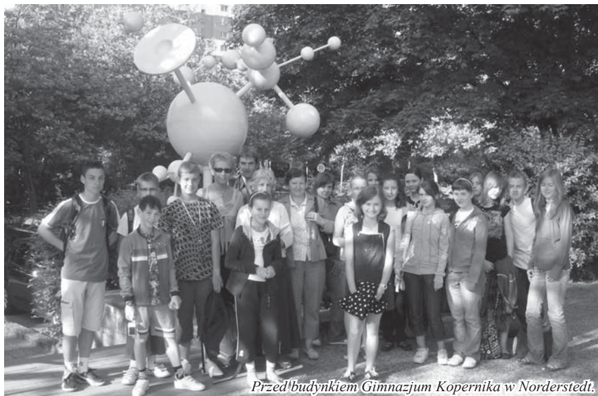
Przed budynkiem Gimnazjum Kopernika w Norderstedt.

W czerwcu br. już po raz osiemnasty doszło do wymiany młodzieży szkolnej z Gimnazjum im. Mikołaja Kopernika w Norderstedt (Niemcy), która współpracuje ze Szkołą Podstawową nr 10 w Tczewie od 1990 roku i z Gimnazjum nr 1 w Tczewie od 2000 roku.