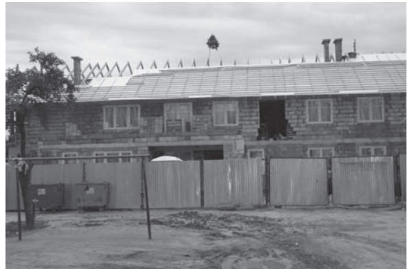
Do nowego budynku komunalnego przy ul. Nowowiejskiej wprowadzi się 18 rodzin.

Przy Szkole Podstawowej nr 11 powstanie natomiast boisko w ramach programu „Moje boisko - Orlik 2012” dofinansowane z budżetu państwa oraz budżetu samorządu województwa pomorskiego. Zadanie obejmuje wykonanie boiska piłkarskiego o sztucznej nawierzchni trawiastej, boiska o sztucznej na-