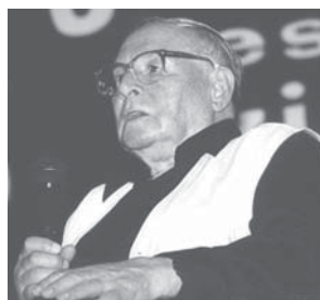
Prof. Józef Szajna

Organizatorzy Zdarzeń czynią starania, aby od dziesiątej, jubileuszowej edycji festiwal nosił zaszczytne imię Józefa Szajny.