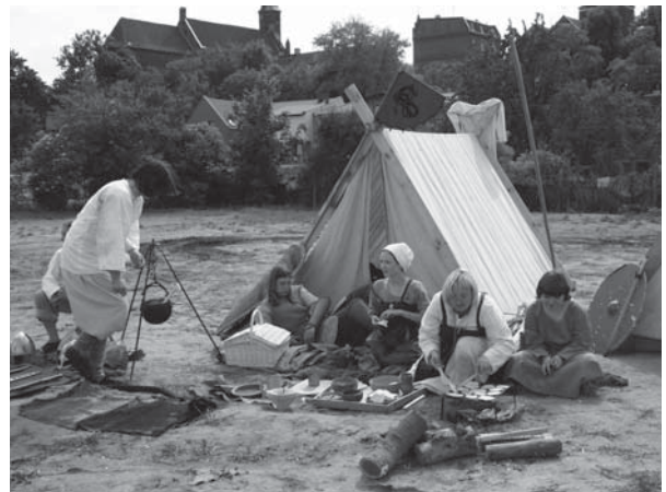
Wioska Wikingów wzbudziła duże zainteresowanie.

Muzycznym atrakcjom towarzyszyło też wiele innych propozycji. Harcerze z tczewskiego hufca rozbili obóz, do którego zapraszali wszystkich chętnych na harcerskie gry i zabawy. Duże zainteresowanie wzbudziła osada Wikingów - można było poznać dawne rzemiosła, sposób wykonywania biżuterii i prostych narzędzi, gry, jakimi umilali sobie czas dawni mieszkańcy północnej Europy oraz postrzelać z łuku. Na chętnych czekał statek Wikingów, którym można było ruszyć w rejs po Wiśle. Towarzystwo Miłośników Ziemi Tczewskiej zapraszało na kociewskie jądło do Chaty Myśliwskiej. Strawę dla ducha przygotowała Miejska Biblioteka Publiczna