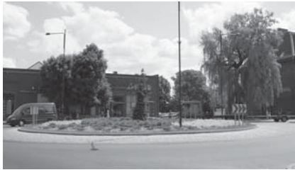
Rondo przy placu Piłsudskiego to jedna z wielu inwestycji powiatowych, wspartych z budżetu miasta.