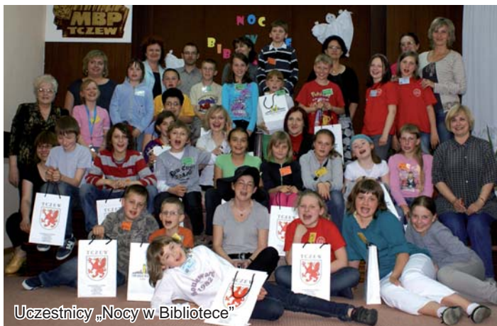
Uczestnicy „Nocy w Bibliotece”

Kolejny punkt imprezy – to oglądanie starych oraz unikatowych pod względem formatu książek wraz z nietypowym przewodnikiem – Panem Tajemniczym. Gdy dwie grupy zwiedzały wystawę, pozostałe bawiły się chustą terapeutyczną aż nadszedł chyba najbardziej wyczekiwany punkt wieczoru – szukanie skarbu na Zapomnianym Strychu. Trzeba było wykazać się nie lada odwagą, żeby wejść do tego straszego pomieszczenia i znaleźć siedem ukrytych przedmiotów. Tym bardziej było