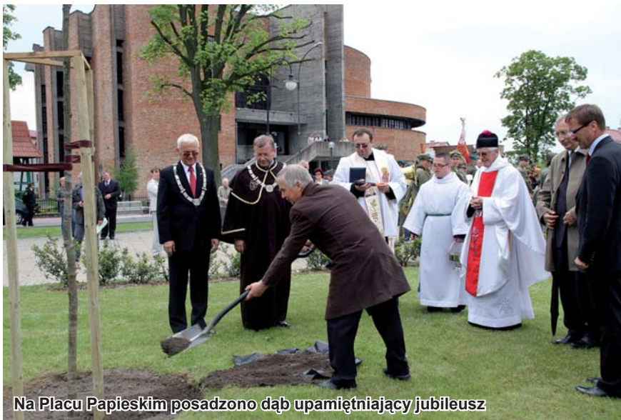
Na Placu Papieskim posadzono dąb upamiętniający jubileusz

porównać Tczew sprzed dwudziestu lat z tym współczesnym. Przez minione 20 lat Tczew zmienił się nie do poznania. Powstało wiele nowych obiektów, wiele wyremontowano. 20 lat temu nie było jeszcze np. Osiedla Bajkowego, Pomorskiej Specjalnej Strefy Ekonomicznej, oczyszczalni ścieków kompleksu odkrytych basenów, przystani, wielu boisk piłkarskich (ul. Ceglarska, ul. Elżbiety, Orliki), Centrum Wystawienniczo-Regionalnego Dolnej Wisły. Amfiteatr był zdewastowany, a bulwar nadwiślański czy kanonka w niczym nie przypominały terenu rekreacyjnego. W miejscu wiaduktu 800-lecia była kładka dla pieszych, a siedziba Zakładu Komunikacji Miejskiej znajdowała się tuż pod oknami oddziału wewnętrznego szpitala. Tczew stał się miejscem wielu ważnych przedsięwzięć kulturalnych jak choćby festiwale ZDARZENIA, FAMILIA, IN MEMORIAM.