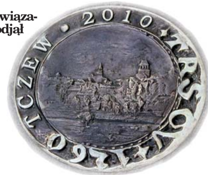
Znak Drogi Widokowej wmurowany w płyty chodnikowe

Zarząd Województwa Pomorskiego wybrał tczewski projekt kierując się opinią Grupy Strategicznej ds. wzrostu atrakcyjności przestrzeni miejskiej, która rekomendowała projekt jako priorytetowy. W uzasadnieniu stwierdzono m.in., że szeroki zakres rzeczowy i kompleksowe działania społeczne realizowane w ramach projektu przez beneficjenta i partnerów projektu dają możliwość skutecznego rozwiązywania wskazanych problemów. W przedsięwzięciu biorą udział inne podmioty – Miejski Ośrodek Pomocy Społecznej, Koło Polskiego Stowarzyszenia na Rzecz Osób z Upośledzeniem Umysłowym, Komenda Powiatowa Policji, Straż Miejska, Zakład Usług Komunalnych, Zakład Gospodarki Komunalnym Zasobem Mieszkaniowym, Akademia Słuk Pięknych w Gdańsku, Politechnika Gdańska, Centrum Wystawienniczo-Regionalne Dolnej Wisły w Tczewie. Zwrócono uwagę na to, że projekt rewitalizacyjny jest powiązany z realizowanymi inwestycjami, jak utworzenie CWRDW, „Infrastruktura turystyczna drogi wodnej Berlin – Kaliningrad – Kłajpeda w Tczewie i Kłajpedzie”, oraz Dom Przedsiębiorcy w Tczewie