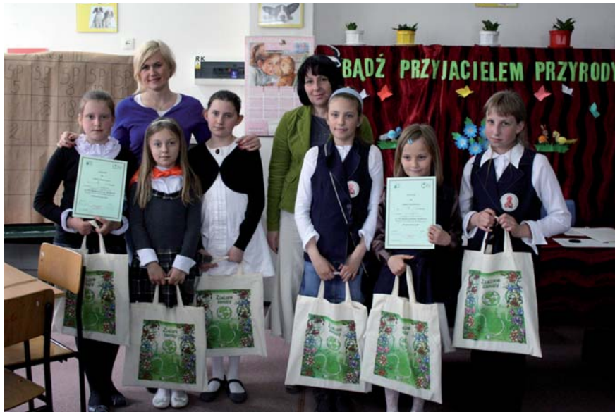
Najlepsze drużyny w kategorii klas III wraz z opiekunami

Jeszcze w czerwcu nasze przedszkolaki zmięrają się w Quizie Ekologicznym , który odbędzie się w Ekologicznym Przedszkolu „Jodelka” .