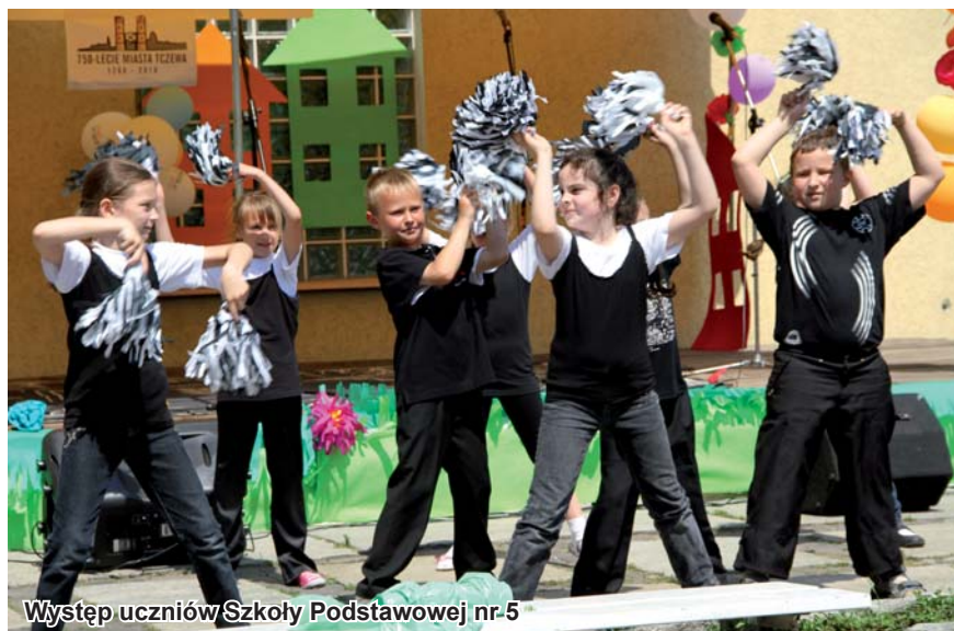
Występ uczniów Szkoły Podstawowej nr-5

Na dzieci czekało mnóstwo gier, zabaw, konkursy, warsztaty artystyczne, trampolina. Można było kupić artystyczne prace podopiecznych MOPS i ośrodków wsparcia. Na zgłodniałych czekał poczęstunek. Była też okazja, aby bezpłatnie pojeździć rikszą. Dzięki czarnoksiężnikowi Stanisławowi Olszewskiemu, można było poznać swoją przyszłość. Wielu młodych ludzi skorzystało z oferty policji i oznakowało rowery.