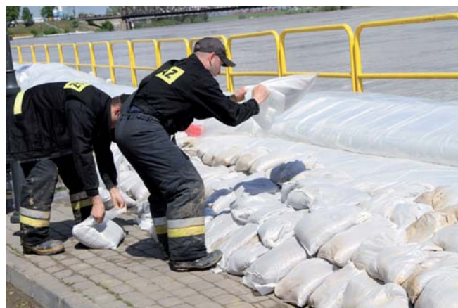
Workami z piaskiem uszczelniano rękaw przeciwpowodziowy