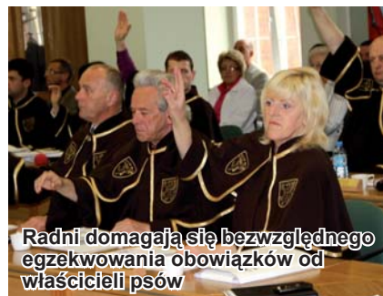
Radni domagają się bezwzględnego egzekwowania obowiązków od właścicieli psów