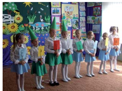
Przedszkolaki co roku uroczycie obchodzą Dzień Ochrony Środowiska