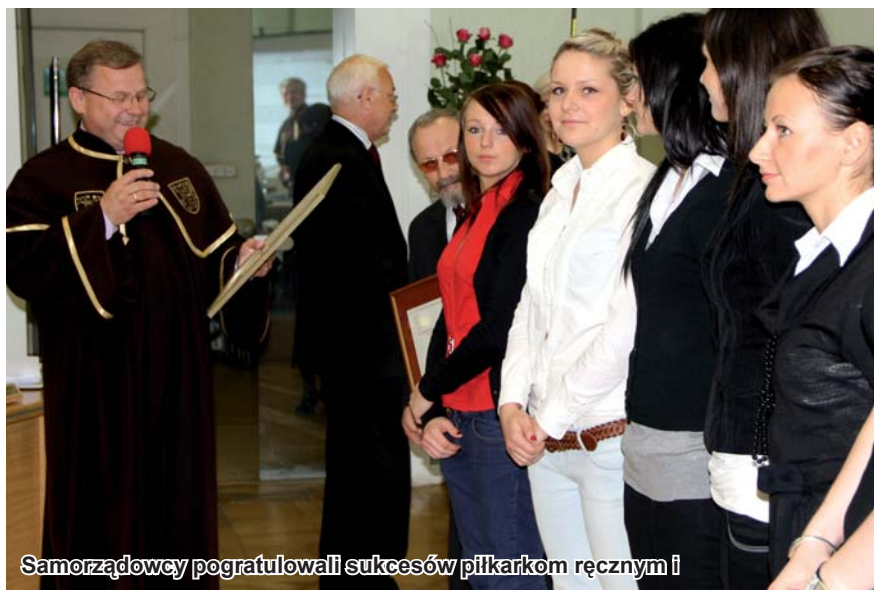
Samorządowcy pogratulowali sukcesów piłkarkom ręcznym i

Prezes, w imieniu całego zespołu podziękował samorządowi miasta za słowa uznania i wspieranie drużyny. Podkreślił, że dzięki grze tczewskiego