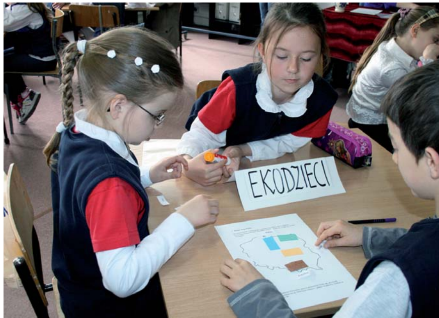
Przyjaciele przyrody muszą znać ukształtowanie powierzchni Polski

Na wszystkich uczestników tego wydarzenia czekają komplety książek o zwierzętach i funkcjonowaniu świata przyrody. Natomiast dyrektorzy przedszkoli, które wykazały się najlepszymi wynikami w selektywnej zbiórce surowców wtórnych otrzymają dyplomy oraz nagrody dla swoich placówek w postaci sprzętu lub innych pomocy dydaktycznych.