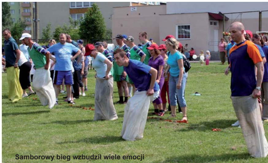
Samborowy bieg wzbudził wiele emocji