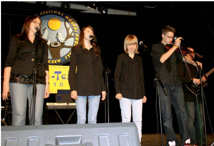
Zespół HP ze Starogardu Gdańskiego

XIII Międzynarodowy Festiwal Muzyki Rodzinnej FAMILIA – Tczew za nami. Tym razem Grand Prix wyśpiewali Słowacy – zespół Kurtulik Band z Namestova. Puchar Przechodni otrzymało miasto Starogard Gdański, a nagroda publiczności trafiła do zespołu Akord z Gostyni Śląskiej.