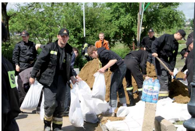
Kto żyw pomagał przygotowywać worki z piaskiem