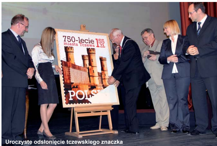
Uroczyste odsłonięcie tczewskiego znaczka

Jak powiedzieli przedstawiciele Poczty Polskiej, nie jest łatwo „umieścić” znaczek w planie emisyjnym poczty. Decyzję w tej sprawie podejmuje Ministerstwo Infrastruktury. Na ten rok zaplanowano emisję jedynie 41 znaczków pocztowych, w tym tylko 34 samodzielnych. Pierwotnie tczewski