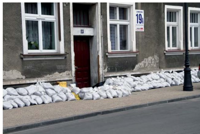
Mieszkańcy budynków położonych w sąsiedztwie bulwaru zabezpieczali swoje domy przed zalaniem