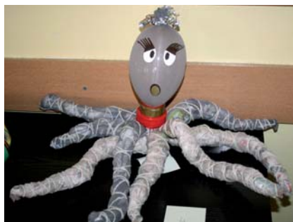
Ekologiczna maskotka z surowców wtórnych – dzieło uczniów z SP 11