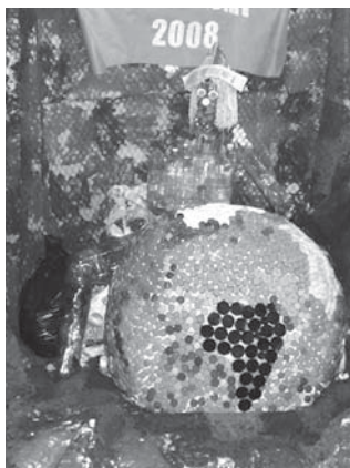
Fragment imponującej „Figury”, jaką zastaliśmy w SP 10 w Tczewie