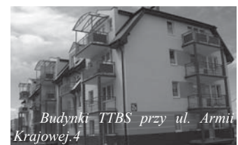
Budynki TTBS przy ul. Armii Krajowej 4