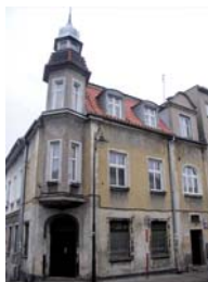
W budynku przy ul. Chopina 33 trwają ostatnie prace adaptacyjne.