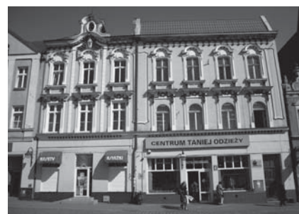
Kamienica przy pl. Hallera 4, należąca dawniej do rodziny Forsterów.