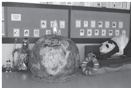
„Figura” wykonana przez uczniów Szkoły Podstawowej nr 12 w Tczewie

– oraz pokazanie sposobu patrzenia na świat zostały osiągnięte.