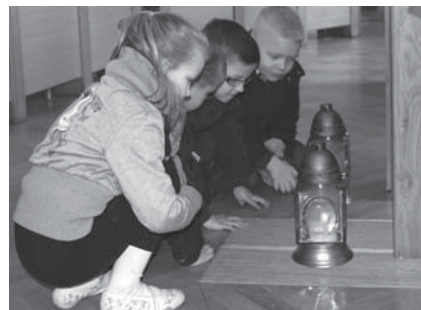
Dzieci z Przedszkola nr 9

Do Księgi Kondolencyjnej wpisywali się m.in.