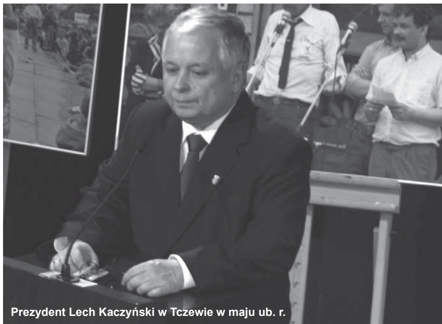
Prezydent Lech Kaczyński w Tczewie w maju ub. r.

Pogrążeni w żalobie po tragicznej śmierci Prezydenta Rzeczypospolitej Polskiej Lecha Kaczyńskiego, Jego Małżonki Marii Kaczyńskiej, posłów i senatorów, przedstawicieli duchowieństwa i wojska oraz osób towarzyszących, kierujemy wyrazy głębokiego żalu, współczucia oraz słowa