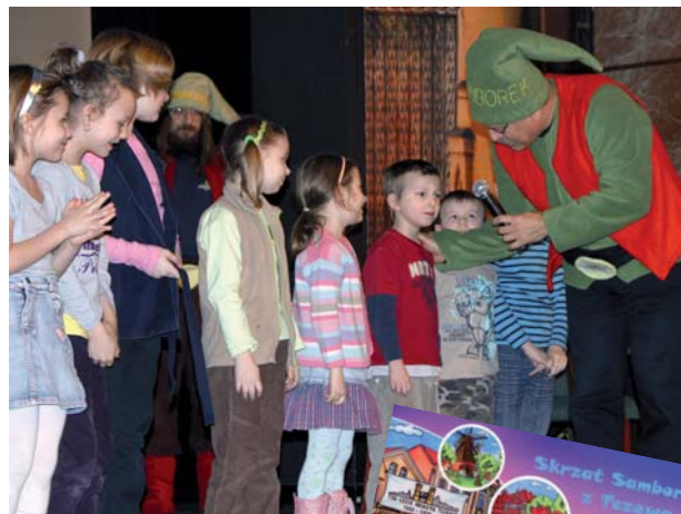
Uczestnicy spotkania ze Skrzatem Samborkiem wzięli udział w konkursie

Książeczka jest bogato ilustrowana, wydana została na zlecenie Biura Promocji UM przez Wydawnictwo Agencji i Promocji Laetari z Zamościa. Publikacja trafiła do tczewskich szkół podstawowych oraz przedszkoli.