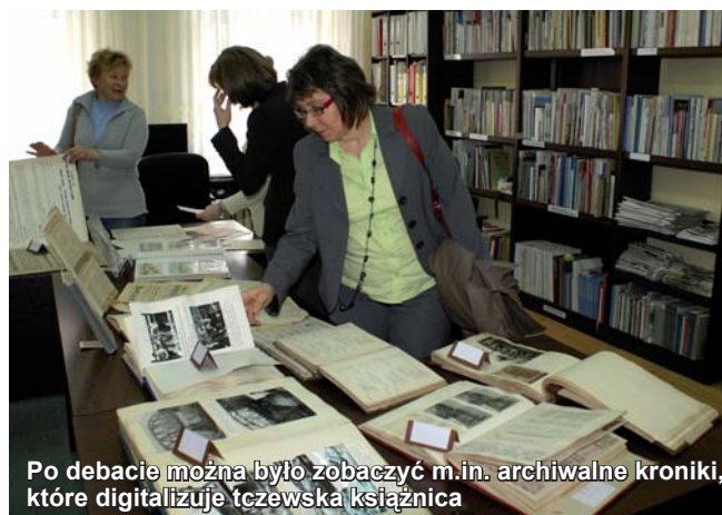
Po debacie można było zobaczyć m.in. archiwalne kroniki, które digitalizuje tczewska księżnica

W drugiej części debaty dyskutowano m.in. o problemach bibliotek cyfrowych. Z najważniejszych wymieniono: rozproszenie zasobów cyfrowych, digitalizacja tych samych zbiorów przez różne biblioteki. Wielką bolączką bibliotekarzy cyfrowych jest nie do końca uregulowana kwestia praw autorskich, na co szczególnie zwrócono uwagę. Dysku-