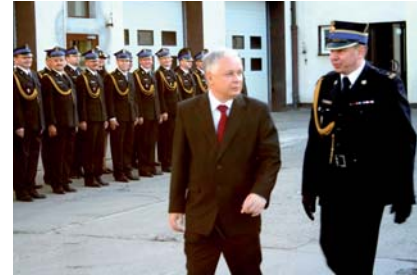
Zdjęcie z wizyty prezydenta Lecha Kaczyńskiego w Tczewie w 2009 r.

15 maja 2009 r. Prezydent Lech Kaczyński odwiedził Tczew. Przyjechał do naszego miasta ze Skórcza, gdzie uczestniczył w jego 75-leciu. Przyjechał do Tczewa około godziny 18:00. Wizytę rozpoczął od złożenia kwiatów pod tablicą upamiętniającą tczewian rozstrzelanych przez Niemców, która znajduje się przy jednostce straży pożarnej. Następnie spotkał się z miesz-