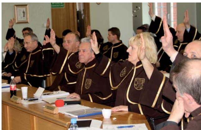
Radni przyjęli protest przez akklamację

Radni miejscy i powiatowi jednogłośnie zaprotestowali przeciwko zdjęciu z anteny TVP Gdańsk regionalnego programu „Na Kociewiu”. Zdaniem rajców, sprawa jest szczególnie bulwersująca wobec przygotowań do IV Kongresu Kociewskiego, który odbędzie się w maju br.