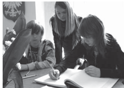
Uczniowie SP 10