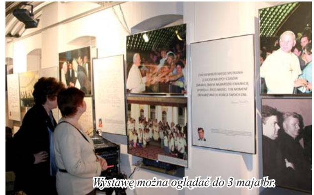
Wystawę można oglądać do 3 maja br.