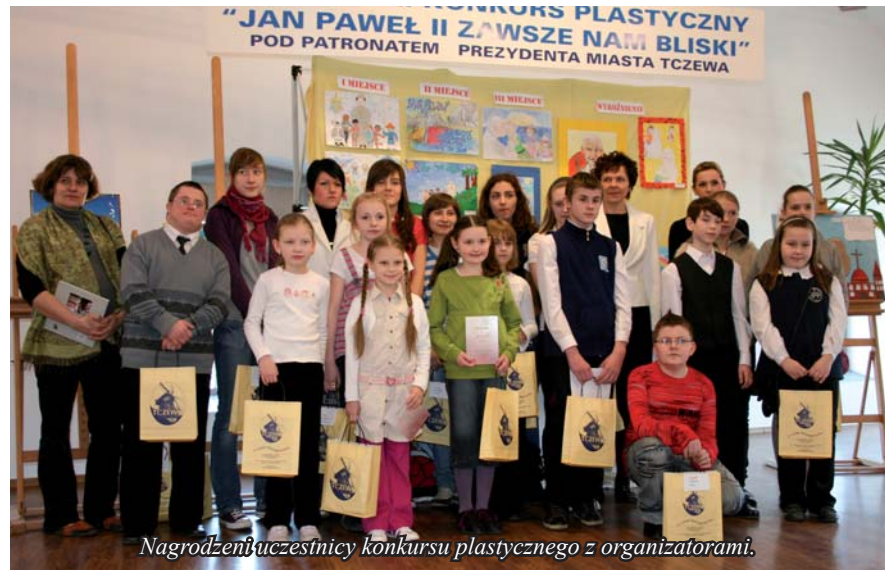
Nagrodzeni uczestnicy konkursu plastycznego z organizatorami.