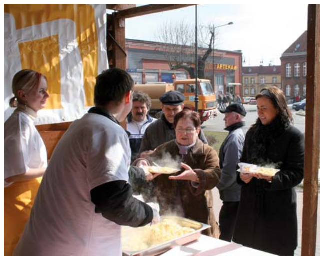
Jajecznicca ze strusich jaj smakowała mieszkańcom Tczewa.