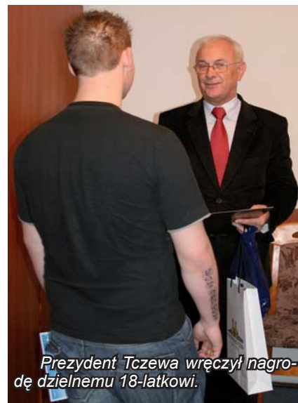
Prezydent Tczewa wręczył nagrodę dzielnemu 18-latkowi.