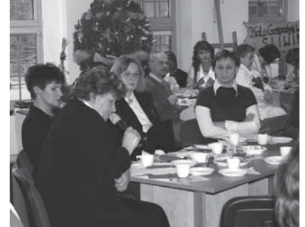
Kobiety z Tczewa i Witten rozmawiały o codziennych problemach.

Rozmawiano także o opiece nad dziećmi umieszczonymi w domach dziecka. W obu krajach odchodzi się od placówek skupiających dużą liczbę dzieci na rzecz rodzin zastępczych i rodzinnych domów dziecka. W Tczewie jednak niewiele rodzin jest zain-