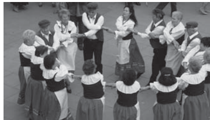
Występ „Wiecznie młodych” podczas ubiegłorocznego Międzynarodowego Dnia Osoby Starszej.

Zespół bierze udział w cyklicznych spotkaniach towarzyskich i wycieczkach rekreacyjnych. Są one doskonałą formą budowania przyjacielskich relacji i zawiązywania głębokich więzi pomiędzy seniorami. Spotkania te pozwalają osobom starszym podzielić się z drugim człowiekiem swoimi problemami, wyrazić własne opinie na nurtujące ich tematy oraz przeżyć niezwykle przygodę. To bardzo cenne doświadczenie, zwłaszcza, że w wielu przypadkach osoby w tym wieku muszą na