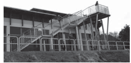
24 maja oficjalnie otwarta zostanie przystań w Tczewie.

W ostatni weekend maja w Tczewie nie zabraknie atrakcji dla miłośników turystyki, sportu, rekreacji, kultury i muzyki. A to wszystko za sprawą trzech ważnych wydarzeń, które odbywać się będą niemal jednocześnie - 24 maja - otwarcie przystani i inauguracja sezonu turystycznego w woj. pomorskim, 23-25 maja - XI Międzynarodowy Festiwal Muzyki Rodzinnej FAMILIA Tczew oraz 24 maja - Mistrzostwa Świata Strongwoman na bulwarze nad Wisłą. 24 maja do Tczewa dotrze też Rajd Kocięwo-Żuławski KLUKA.