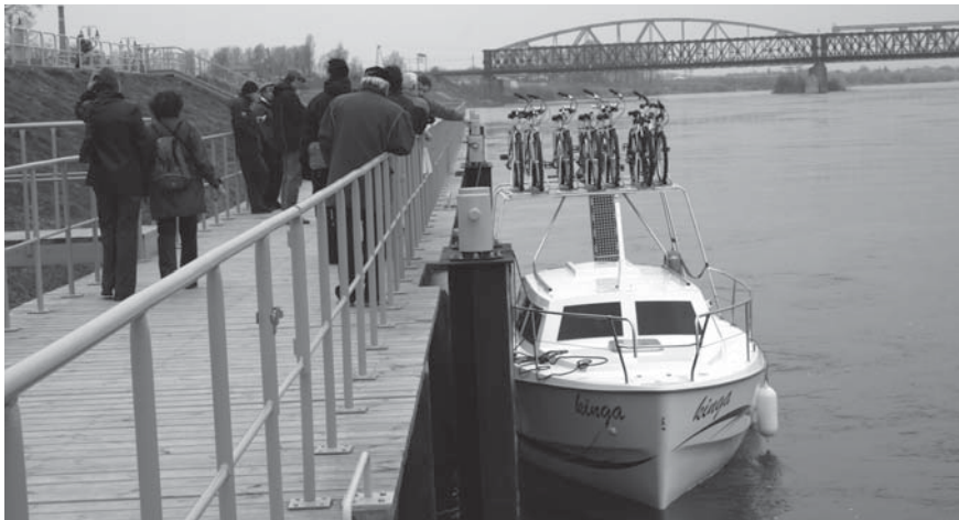
Zaloga „Kingi” zapewniła, że jeszcze nie raz przybije do tczewskiej przystani.

Choć otwarcie przystani żeglarsko-pasażerskiej w Tczewie zaplanowano dopiero na 24 maja, już 5 kwietnia do nowej przystani przybiła pierwsza łódź. Kinga - jedna z pięciu jednostek Żeglugi Wiślanej, zatrzymała się w Gdańsku, Tczewie, Grudziądzu, Bydgoszczy i Toruniu.