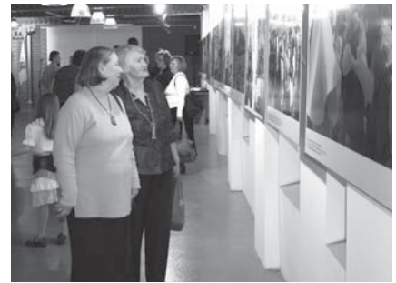
Wystawa czynna będzie do 27 kwietnia.