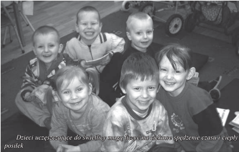
Dzieci uczęszczające do świetlicy mogą liczyć na ciekawe spędzenie czasu i ciepły posiłek

W tym roku mija 10 lat od powstania w Tczewie świetlicy środowiskowej przy ul. Kopernika 9. 1 kwietnia 1998 r., z inicjatywy Zarządu Miejskiego Polskiego Komitetu Pomocy Społecznej przy współpracy z Miejskim Ośrodkiem Pomocy Społecznej, do życia powołana została placówka, której głównym celem stała się pomoc i opieka nad dziećmi z rodzin dysfunkcyjnych lub znajdujących się w trudnej sytuacji materialnej.