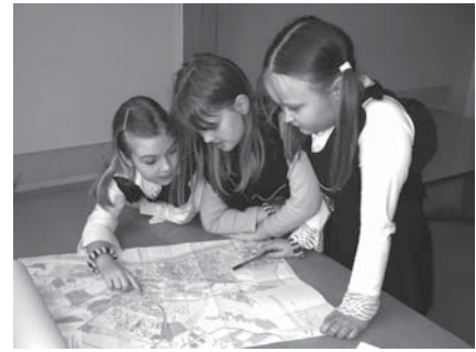
Uczestnicy konkursu musieli umieć posługiwać się mapą.