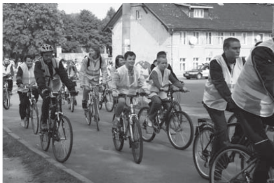
Dzień bez samochodu w Tczewie - 22 września 2007 r. W tym roku planujemy podobny przejazd.

- Próbujemy znaleźć w Europie miasta przyjazne rowerzystom porównywalne z Tczewem i skorzystać z ich doświadczeń w tej dziedzinie.