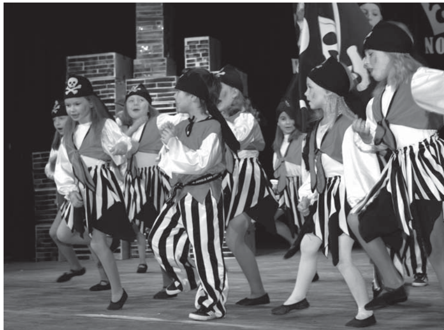
Tczewskie przedszkola chętnie uczestniczą w miejskich wydarzeniach kulturalnych. Na zdjęciu występ dzieci z Przedszkola nr 8 podczas wyborów Miss i Mistera Złotego Wieku w styczniu br.

Odpłatność: 160 zł/m-c (opłata stała) + 3 zł