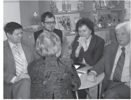
Uczestnicy warsztatów zmierzyli się z zadaniem stworzenia kampanii na rzecz budowy pozytywnego wizerunku instytucji.