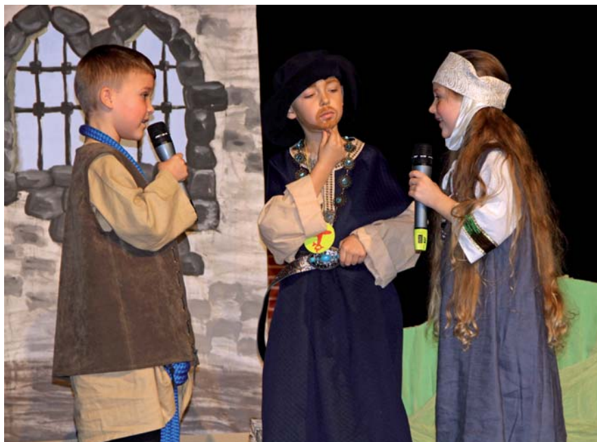
Dzieci z Przedszkola nr 8 wzięły udział w III Konkursie Literackim im. Romana Landowskiego