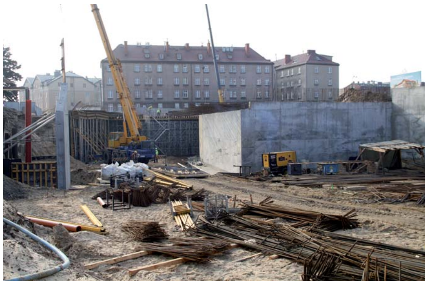
Na „węźle” – wkrótce ruszy budowa płyty górnej tunelu

Rozpoczęły się także prace przygotowawcze związane z budową placu, na którym usytuowany będzie dworzec autobusowy.