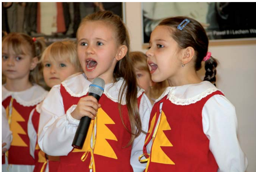
Przedszkolaki z „Jarzębinki” chętnie prezentują swoje taneczne i wokalne umiejętności