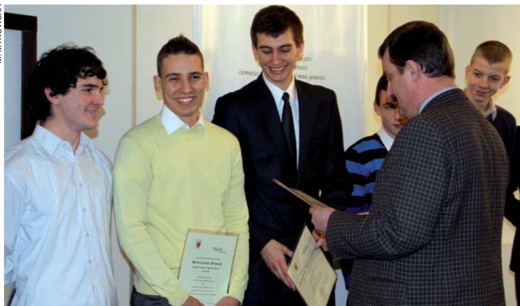
Nagrody prezydenta otrzymali m.in. piłkarze ręczni MKS Sambor