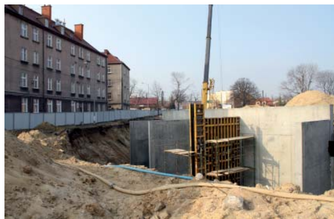
Budowa tunelu – marzec 2011 r.