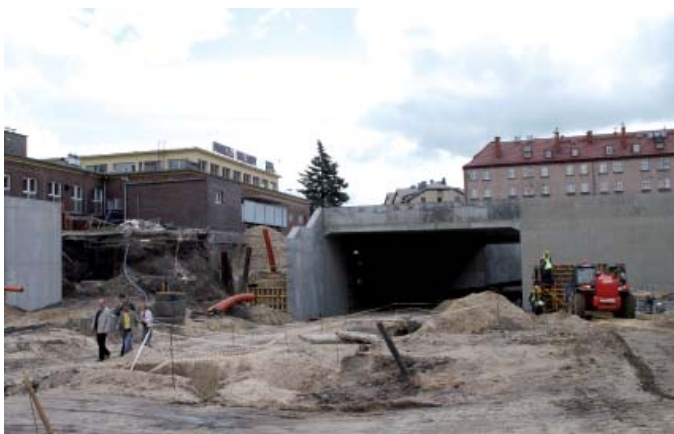
...tunel również – lipiec 2011 r.