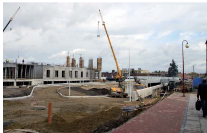
Budowa placu przed dworcem PKP – październik 2011 r.