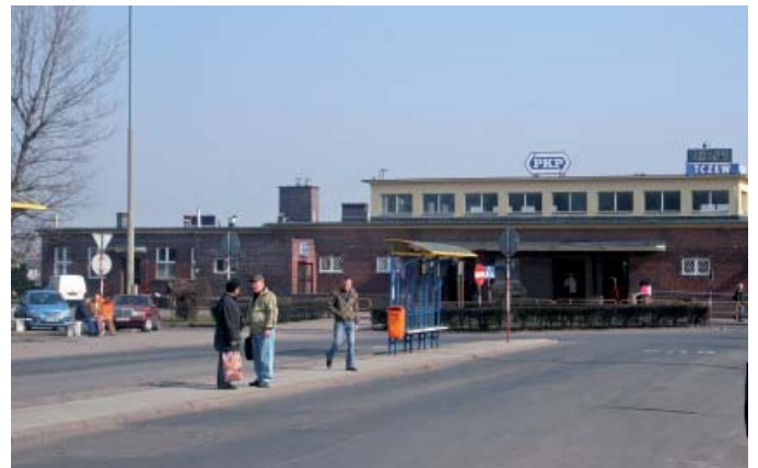
Teren przed dworcem PKP przed rozpoczęciem inwestycji – marzec 2010 r.