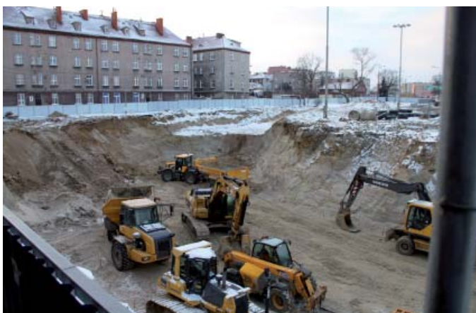
Wykop pod tunel – grudzień 2010 r.