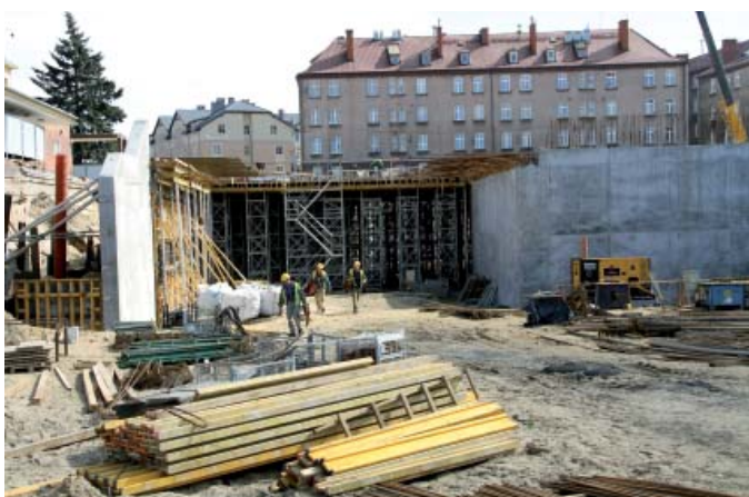
Powstaje górna płyta tunelu – kwiecień 2011 r.