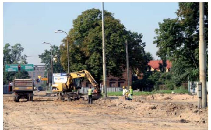
30 czerwca 2010 r. wykonawca wszedł na plac budowy. Na zdjęciu – pierwsze prace budowlane – sierpień 2010 r.