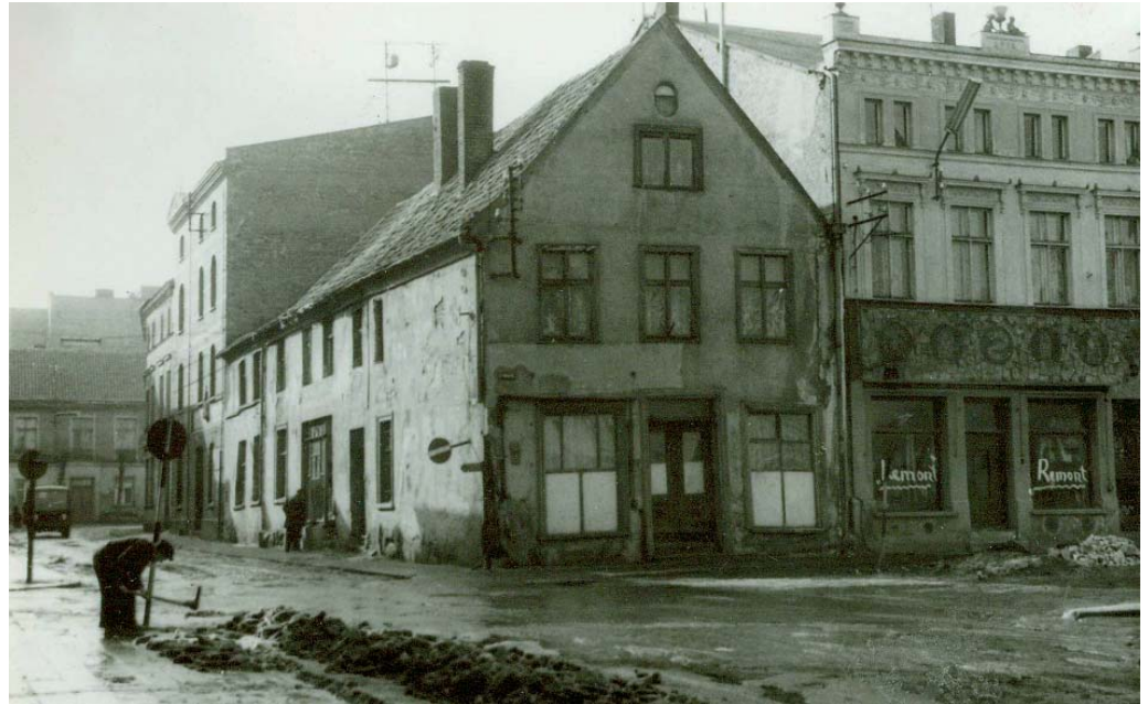
Nieistniejąca kamienica na Rynku nr 19, ok. 1960 r.