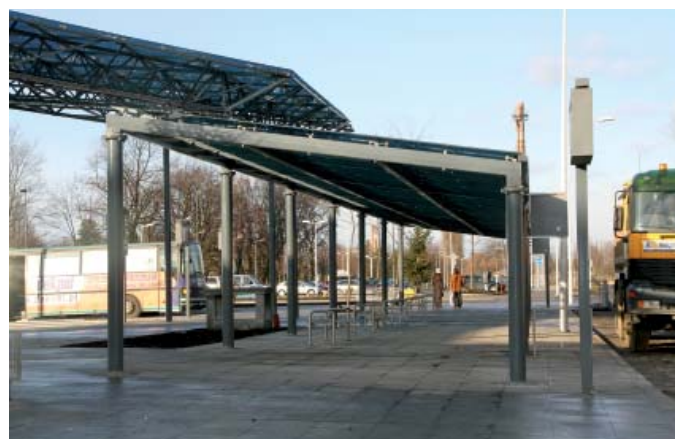
Przystanki autobusowe – styczeń 2012 r.