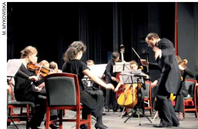
Orkiestra Kameralna PROGRESS