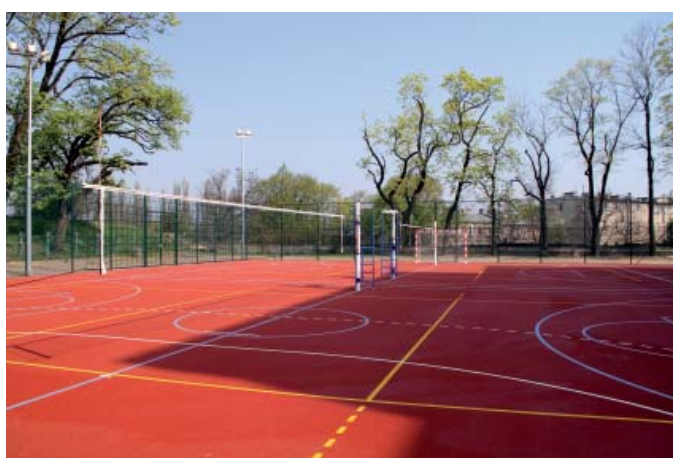
W 2011 r. uczniowie SP 5 otrzymali nowe boisko...

średnie wyniki testu szóstoklasistów w 2011 r.: 23,93*