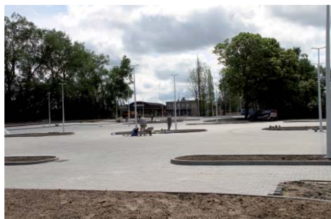
Parking prawie gotowy – lipiec 2011 r.