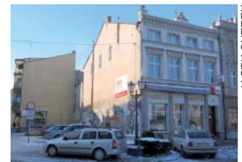
Pusta działka na placu Hallera nr 19