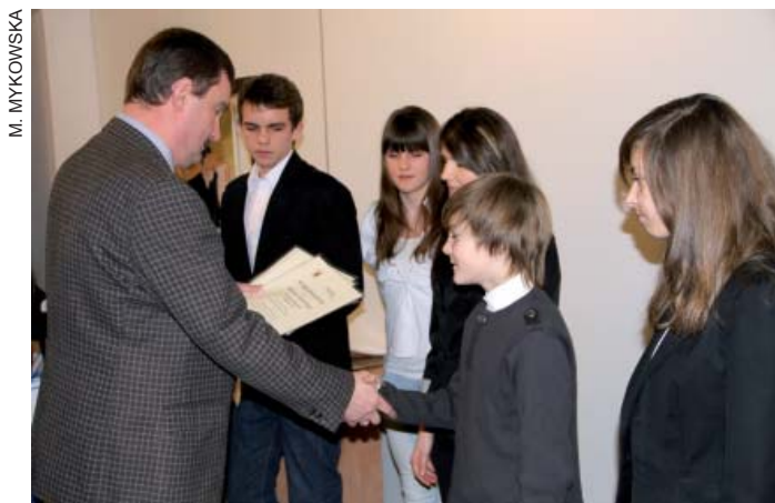
Nagrody rzeczowe odebrali młodzi adepci karate shotokan