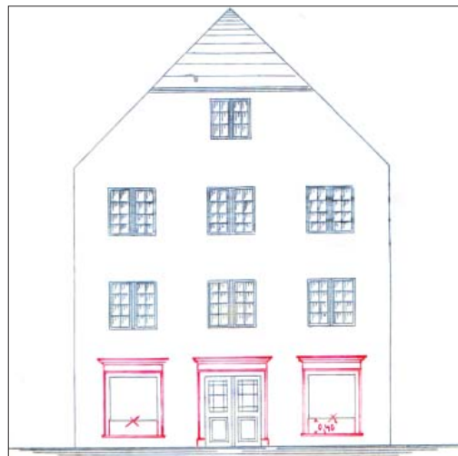
Szkic jednej z kamienic przylegających do ratusza, 1910 r.