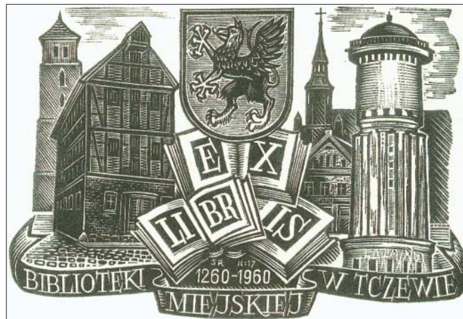
Stary spichlerz na jubileuszowym exlibrisie.