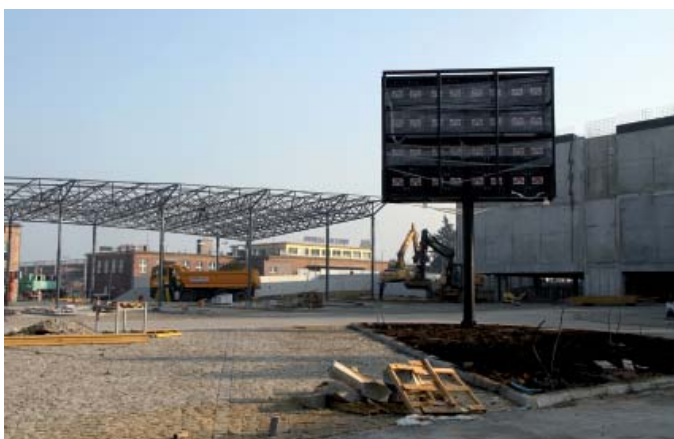
Plac manewrowy – listopad 2011 r.