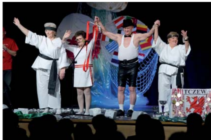
Seniorzy na scenie

Organizatorami Wyborów byli: Zarząd Miejski Polskiego Komitetu Pomocy Społecznej oraz Miejski Ośrodek Pomocy Społecznej w Tczewie. Współorganizację powierzone Centrum Kultury i Sztuki w Tczewie.