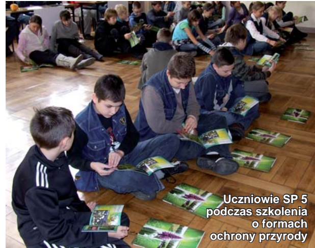
Uczniowie SP 5 podczas szkolenia o formach ochrony przyrody

Bez dodatkowych działań, utrata różnorodności biologicznej będzie postępować, a wręcz ulegnie przyspieszeniu. Trzeba zrobić jeszcze więcej, aby ochronić ekosystemy lądowe i morskie. W tym celu niezbędne jest ograniczenie połowów niektórych gatunków na wybranych obszarach oraz lepsze zarządzanie wodami śródlądowymi. Poprawie musi ulec