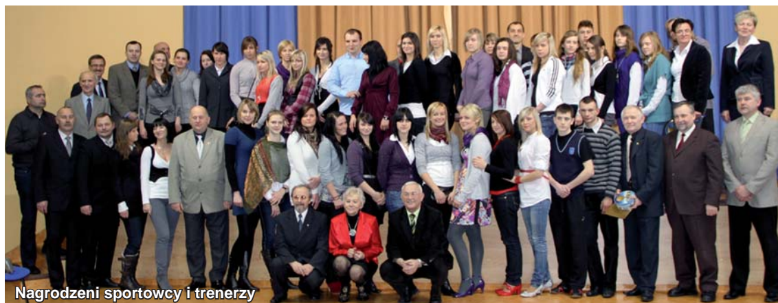
Nagrodzeni sportowcy i trenerzy