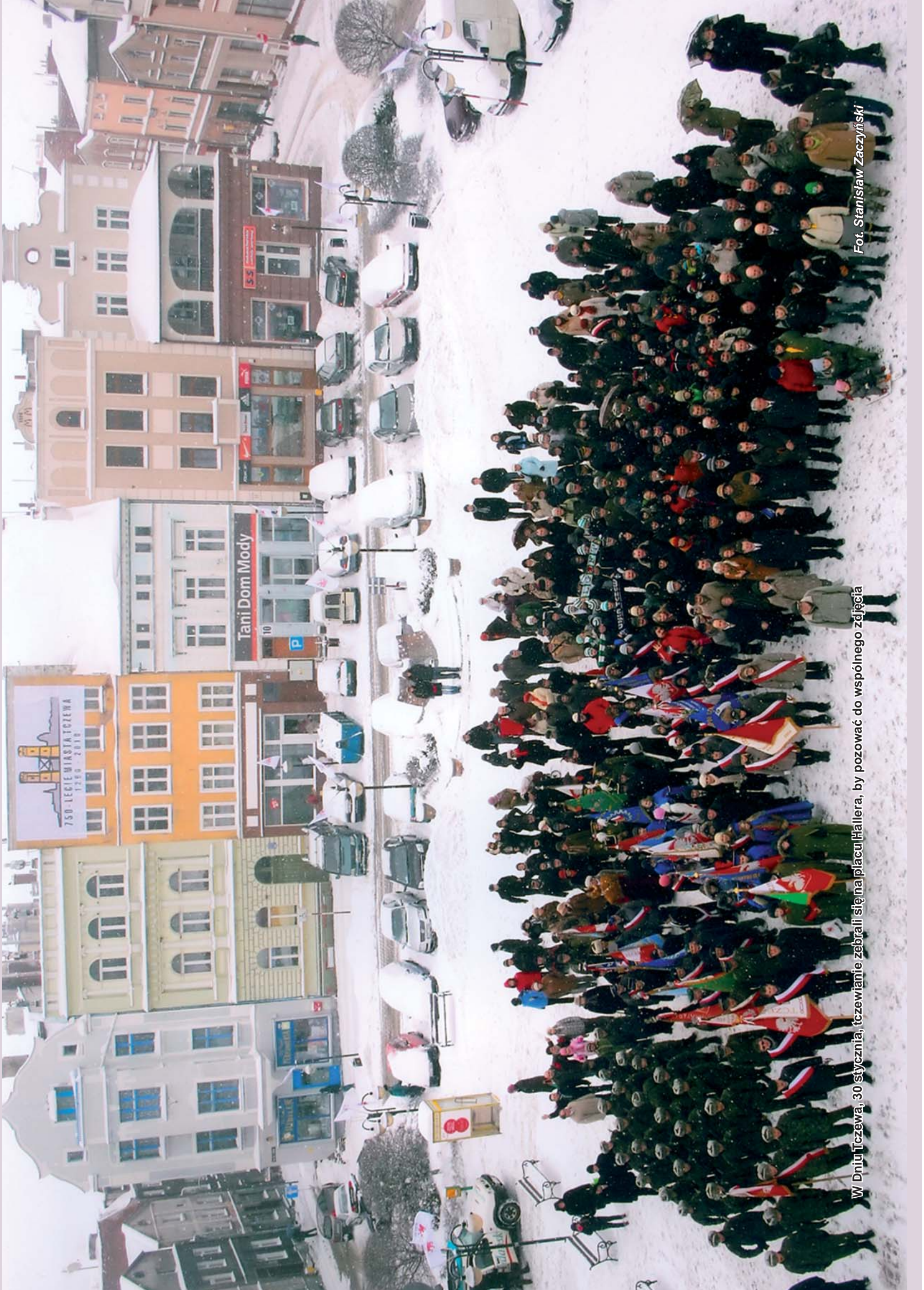
W Dniu Trzeźwa, 30 stycznia, uczczenie zebrałi się na placu Hallera, by pozować do wspólnego zefjęcia