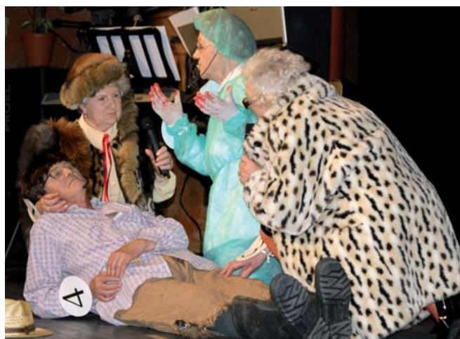
Nie wszyscy uszli cało z imprezy...