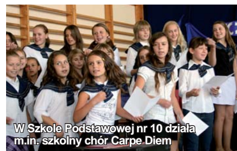
W Szkole Podstawowej nr 10 działa m.in. szkolny chór Carpe Diem

* Maksymalny wynik testu to 40 pkt., średnia w woj. pomorskim: 22,29 pkt., w powiecie tczewskim: 21,31 pkt.