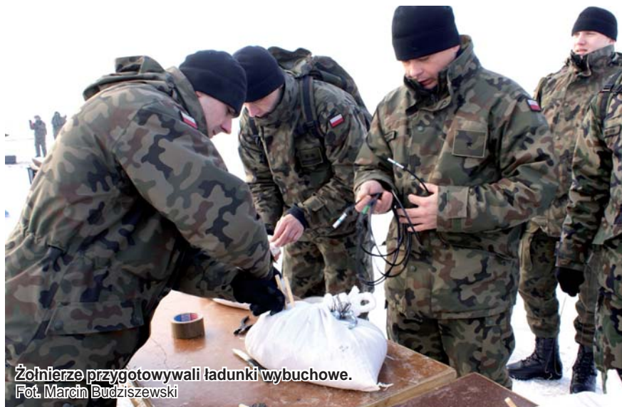
Żołnierze przygotowali ładunki wybuchowe.

Likwidację zatorów lodowych materiałem wybuchowym wykładanym ze śmigłowców ćwiczyły załogi statków powietrznych Lotnictwa Wojsk Lądowych i żołnierze Inżynieryjnych Wojsk Lądowych. Kilkudniowe ćwiczenia odbywały się na terenie ćwiczebnym 16. Tczewskiego Batalionu Saperów, w pobliżu mostów tczewskich od strony Lisewa. W ostatnim dniu żołnierzy odwiedzili m.in. tczewscy samorządowcy.