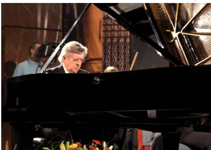
Koncert Piotra Palecznego i orkiestry Le Quattro Stagioni zachwycił publiczność.