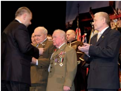
Min. Jacek Sasin wręczył odznaczenia państwowe.