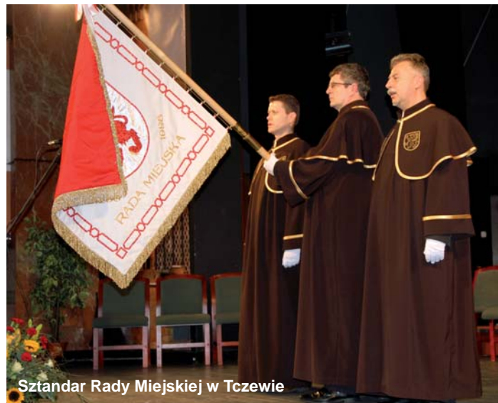
Sztandar Rady Miejskiej w Tczewie