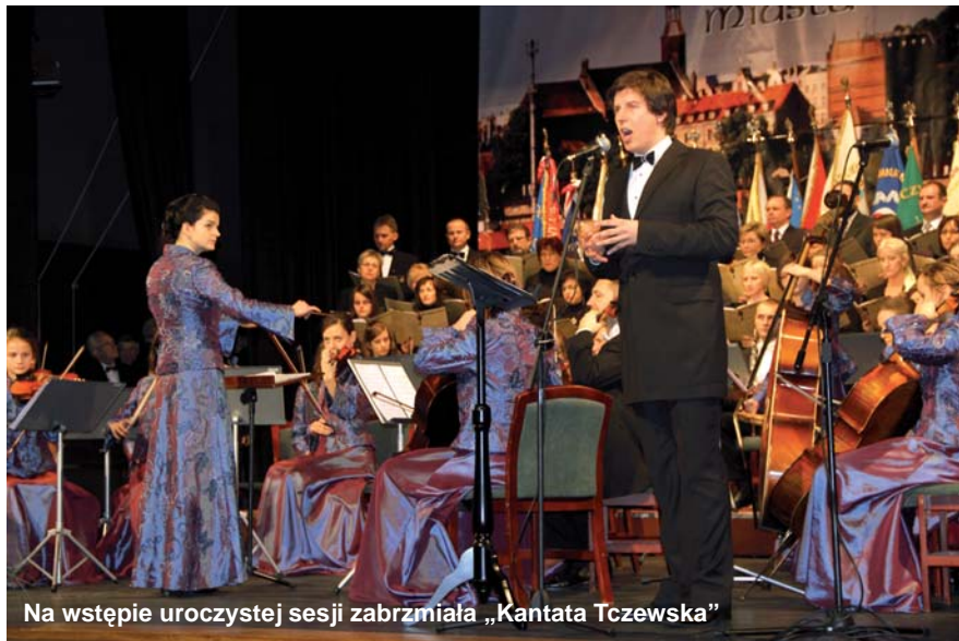
Na wstępie uroczystej sesji zabrzmiała „Kantata Tczewska”