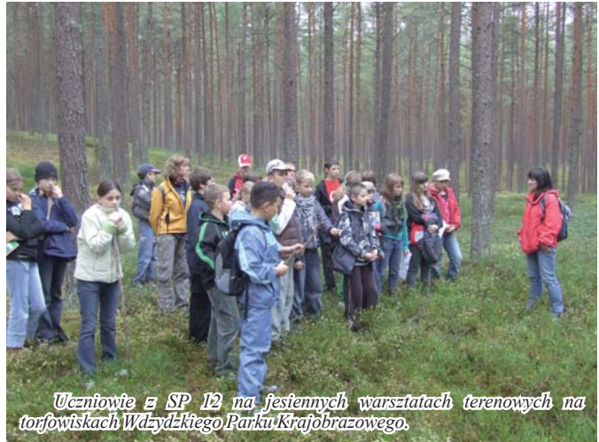
Uczniowie z SP 12 na festiwnych warsztatach terenowych na torfowiskach Wdzydzkiego Parku Krajobrazowego.

o tematyce ekologicznej pt. „Pory roku w piosence”. Przedszkola reprezentowało 45 dzieci.