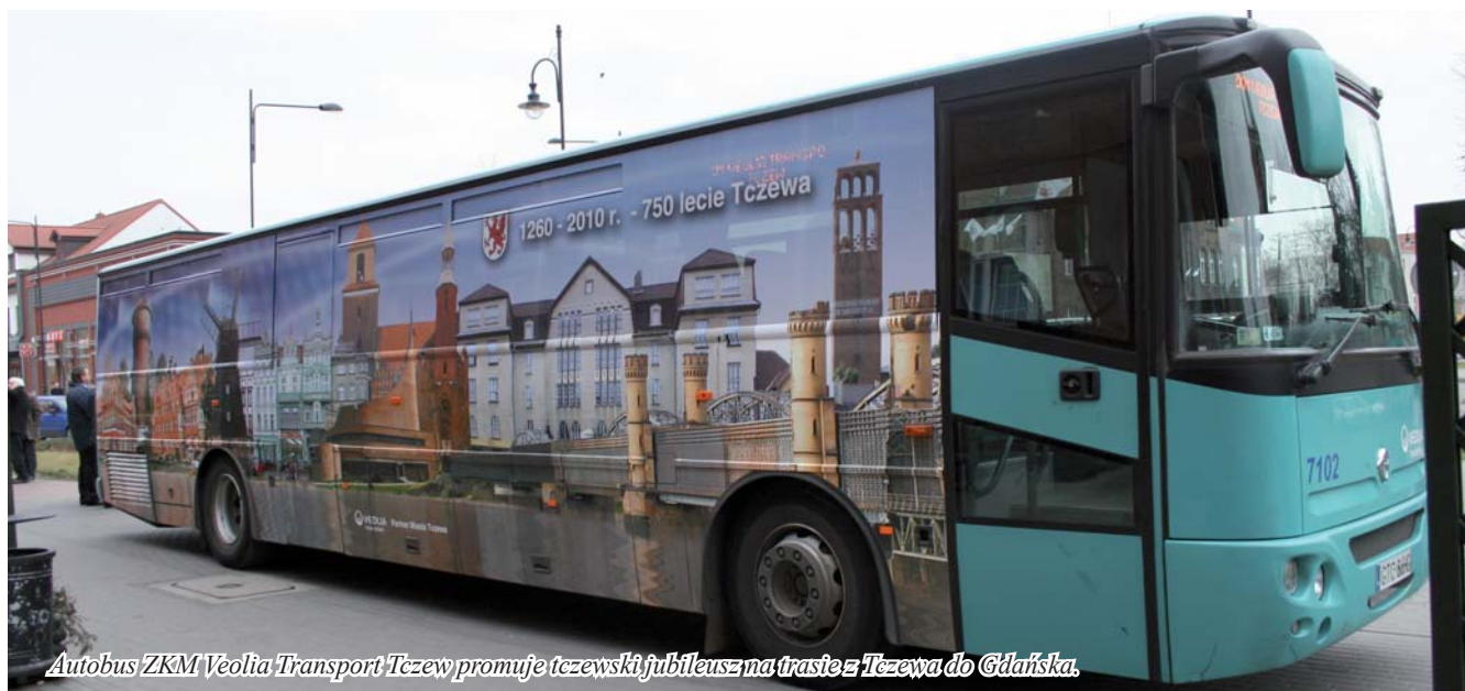
Autobus ZKM Veolia Transport Tczew promuje tczewski jubileusz na trasie z Tczewa do Gdańska.