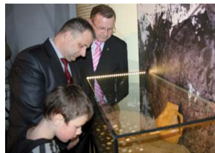
„Każdy chciał zobaczyć „skarby tczewski”.

Tzw. Skarb tczewski odkryto jesienią 1976 roku przy ulicy Rutkowskiego 21 (dzisiaj Armii Krajowej). Były to fragmenty naczyń oraz ok. 919 sztuk srebrnych