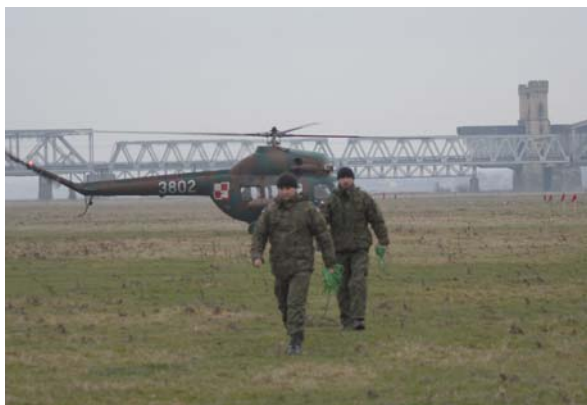
Zadaniem załogi helikoptera było położenie ładunku na powierzchni lodu (w tym wypadku na trawie).

czonych żołnierzy. Konieczne jest zdobycie umiejętności koordynacji pracy pilota śmigłowca i żołnierza wojsk inżynieryjnych. Pierwszy jest odpowiedzialny na sterowanie śmigłowcem, drugi za przygotowanie i umieszczenie ładunku wybuchowego na lodzie.