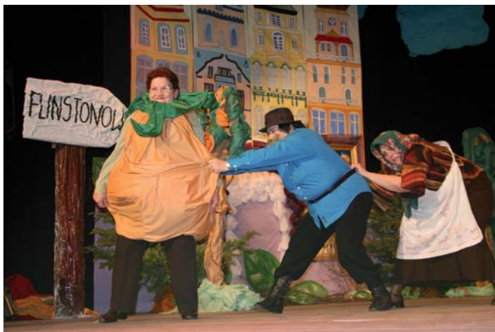
Zasadził dziadek rzepkę w ogrodzie...

Patronat nad Wyborami sprawuje Prezydent Miasta Tczewa, Marszałek Województwa Pomorskiego, agenda ONZ w Polsce, stowarzyszenie Akademia Rozwoju Filantropii w Polsce, organizacje seniorskie zrzeszone w platformie Forum 50+ Seniorzy XXI Wieku!, Tczewski Oddział Gdańskiego Związku Pracodawców. Działania ZM PKPS w Tczewie na rzecz osób starszych rekomenduje Fundacja Ja Kobieta – organizacja pozarządowa działająca na rzecz integracji społecznej osób wykluczonych.