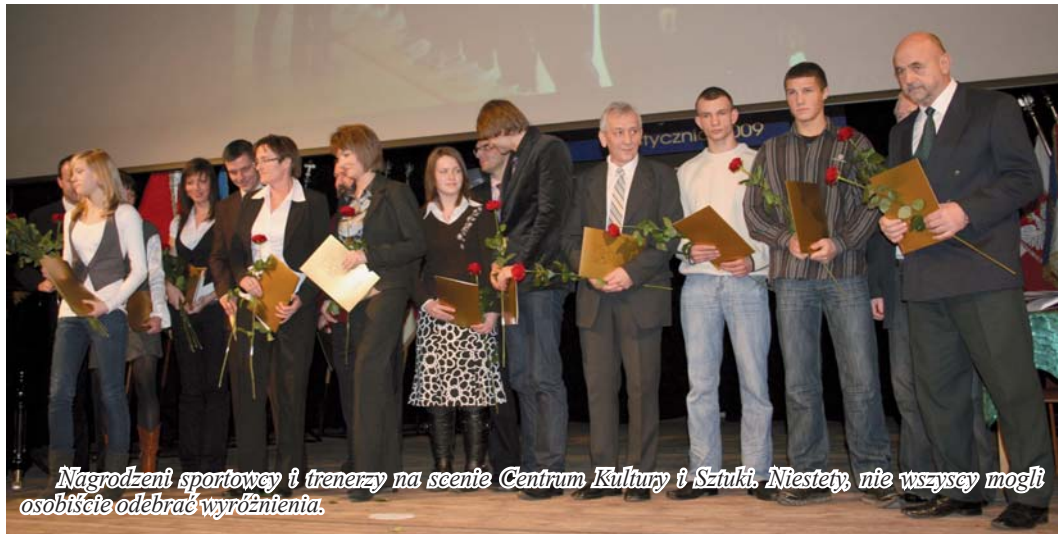
Nagrodzeni sportowcy i trenerzy na scenie Centrum Kultury i Sztuki. Niestety, nie wszyscy mogli osobiście odebrać wyróżnienia.