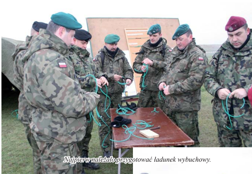
Najpierw należało przygotować ładunek wybuchowy.

– Siły zbrojne realizują nie tylko zadania obronne, uczestniczą w misjach pokojowych, ale także wykorzystywane są podczas sytuacji kryzysowych – wyjaśniał gen. dyw. Wiesław Michnowicz , dowódca 16. Pomorskiej Dywizji Zmechanizowanej, nadzorujący ćwiczenia. – Szczególnie dotyczy to sytuacji takich