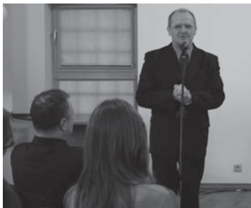
Spotkanie w CWRDW.

Rozmowy dotyczyły również inwestycji tczewskich. Uczestnicy spotkania niepokoili się, czy wobec konieczności przeznaczenia ogromnych środków na autostrady i Euro 2012,