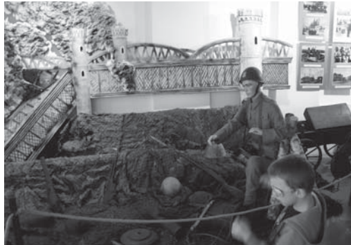
Wystawa czynna będzie do 31 grudnia 2008 r.

Ekspozycję otwarto w Dniu Tczewa - 30 stycznia. Spotkamy na niej historyczne postacie w autentycznych strojach, a więc Sambora II, Krzyżaka, żaka, gen. Henryka Dąbrowskiego, gen. Józefa Hallera i żołnierza z 2. Baonu Strzelców. Każda z tych postaci jest pretekstem do zagłębienia się w historię Tczewa. Można ją także wyczytać z kopii starych dokumentów udostępnionych przez Archiwum Państwowe w Gdańsku ( m.in. akt nadania praw miejskich Tczewowi), wielkoformatowych fotografii z Lubiszewa i Tczewa. Dla tych którzy bardziej chcą się zainteresować historią miasta przygotowano plansze z najważniejszymi datami z historii Tczewa. Uzupełnieniem wystawy są prezentacje multimedialne nawiązujące do ważniejszych wydarzeń historycznych. Spotkanie z historią kończy film pokazujący Tczew po roku 1989.