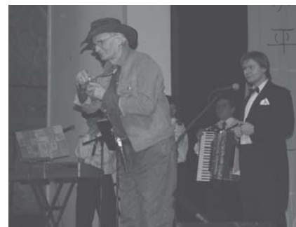
Seniorzy w Hollywood...