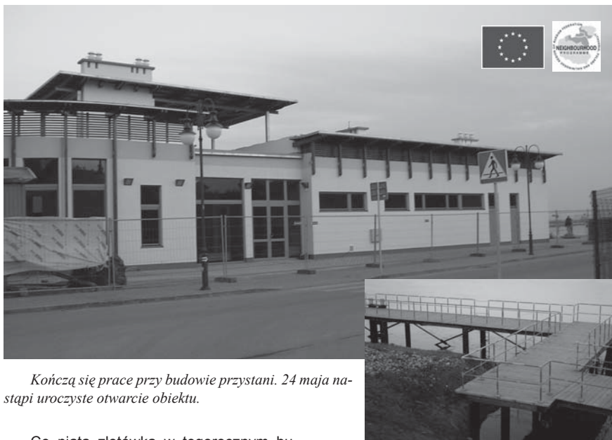
Kończą się prace przy budowie przystani. 24 maja nastąpi uroczyste otwarcie obiektu.

Co piąta złotówka w tegorocznym budżecie miasta przeznaczona zostanie na inwestycje. Najbardziej kosztowne zadania samorząd miasta ma nadzieję zrealizować przy pomocy środków zewnętrznych, stąd kilka projektów będzie aplikować o wsparcie w ramach Regionalnego Programu Operacyjnego Województwa Pomorskiego. Należy do nich m.in. sztandarowa inwestycja Tczewa - czyli regionalny węzeł komunikacyjny.