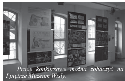
Prace konkursowe można zobaczyć na I piętrze Muzeum Wisły.

1 kwietnia br. mija termin ważności „książeczkowych” dowodów osobistych. Przypominamy, że Biuro Dowodów Osobistych czynne jest w poniedziałki, wtorki, czwartki i piątki w godz. 7.30 do 15.30, w środy w godz. 7.30-17.00. Druki wniosków oraz potrzebne informacje można uzyskać także w Biurze Obsługi Klienta na parterze, w budynku głównym Urzędu Miasta oraz można je pobrać ze strony internetowej Biuletynu Informacji Publicznej: www.bip.bazagmin.pl/tczew