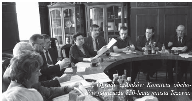
Obrazy członków Komitetu obchodów jubileuszu 750-lecia miasta Tczewa.

Od 30 stycznia br. zegar zainstalowany przed Urzędem Miejskim odlicza dni do rozpoczęcia Roku Jubileuszowego. W 2010 roku Tczew obchodzić będzie 750-lecie nadania praw miejskich. Komitet obchodów jubileuszu już od kilku miesięcy pracuje nad programem uroczystości, które zostaną za-