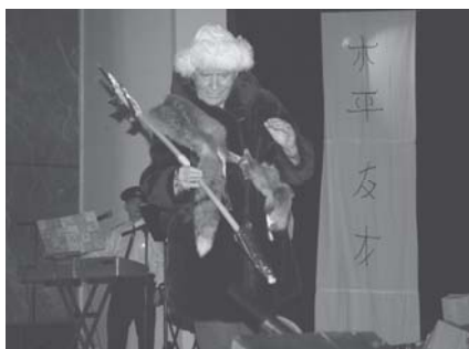
... i na Antarktydzie.