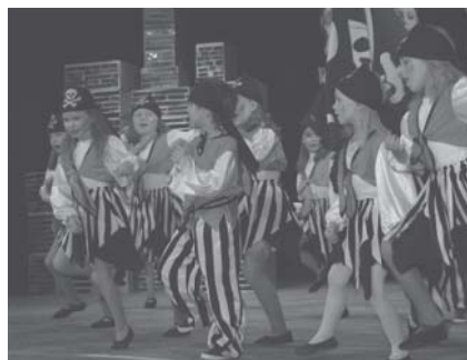
Piraci z Przedszkola nr 9.