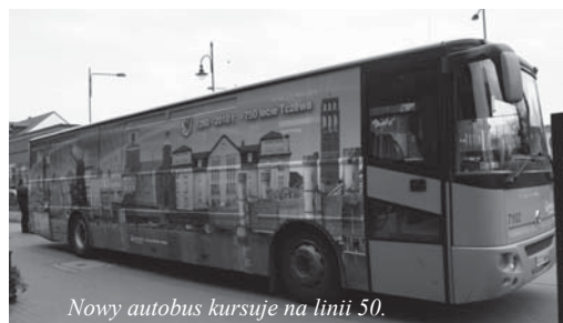
Nowy autobus kursuje na linii 50.