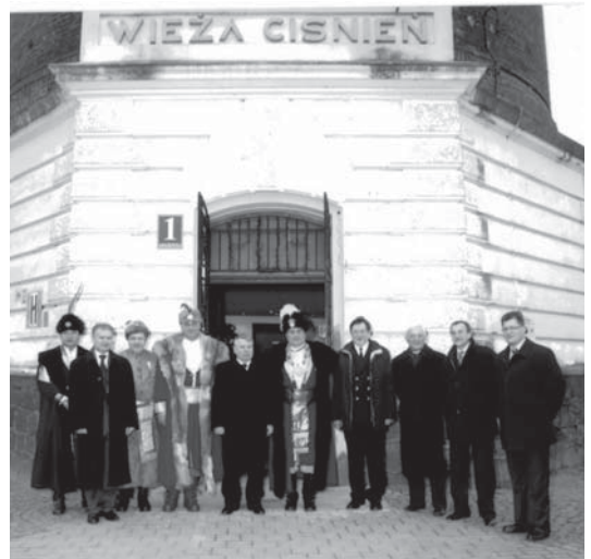
Nowi gospodarze i ich goście przed Wieżą Ciśnień.

Przy okazji reaktywacji trzeba było określić stroje, które współcześni członkowie będą nosić. Tradycyjnie bractwa z północnej Polski nosiły stroje na wzór pruski - zielone marynarki, ciemne spodnie, kapelusz. Tczewianie postanowili inaczej - zgodnie z sugestią bractwa z Krakowa, które jako jedyne w Polsce działało nieprzerwanie od średniowiecza, przypomnieli modę sarmacką. Mają więc szable, żupany, kontusze.